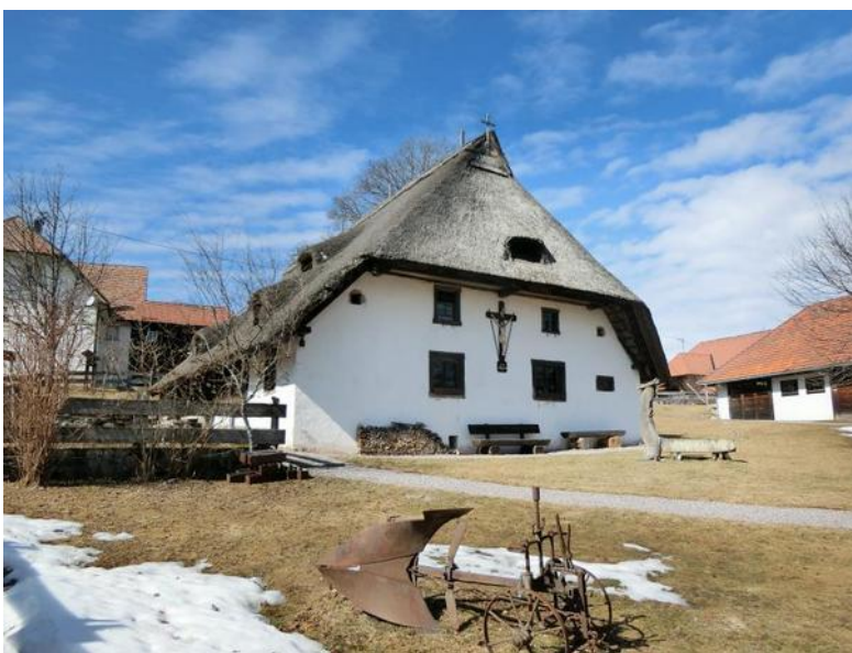
Klausenhof (musée local)