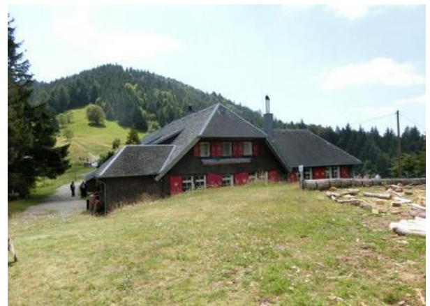
Kälbelescheuer: restaurant typique