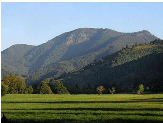
Belchen: 3ème plus haut sommet de la Fôret-Noire

Télépherique jusqu'au Sommet du Belchen et retour – Haldenhof- Kälbelescheuer (dejeuner dans un chalet typique)